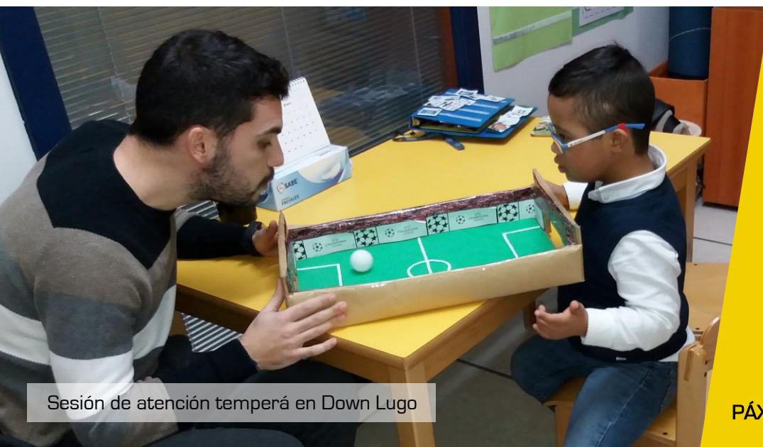
Sesión de atención temperá en Down Lugo

Coñecida como a 'Lei Rhodes', polo pianista británico do mesmo apelido, James Rhodes, que sufriu abusos sexuais cando era un neno e que loitou pola súa aprobación, esta norma de vital importancia protexerá aos menores fronte todo tipo de violencia, especialmente fronte aos abusos sexuais. Aumentará o prazo de prescrición do delito de abuso sexual a menores, de forma que este empezará a contar a partir do momento en que a vítima